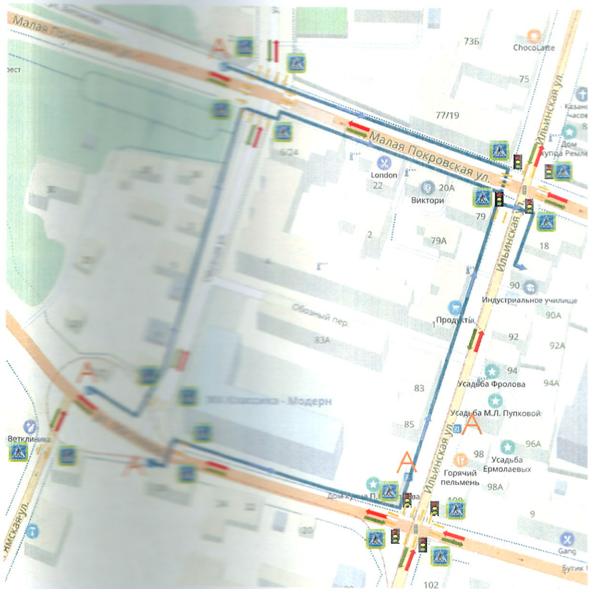
План-схема района расположения ГБПОУ «Нижегородский технологический техникум» по адресу: г. Нижний Новгород, ул. Ильинская, д. 90, пути движения транспортных средств и воспитанников